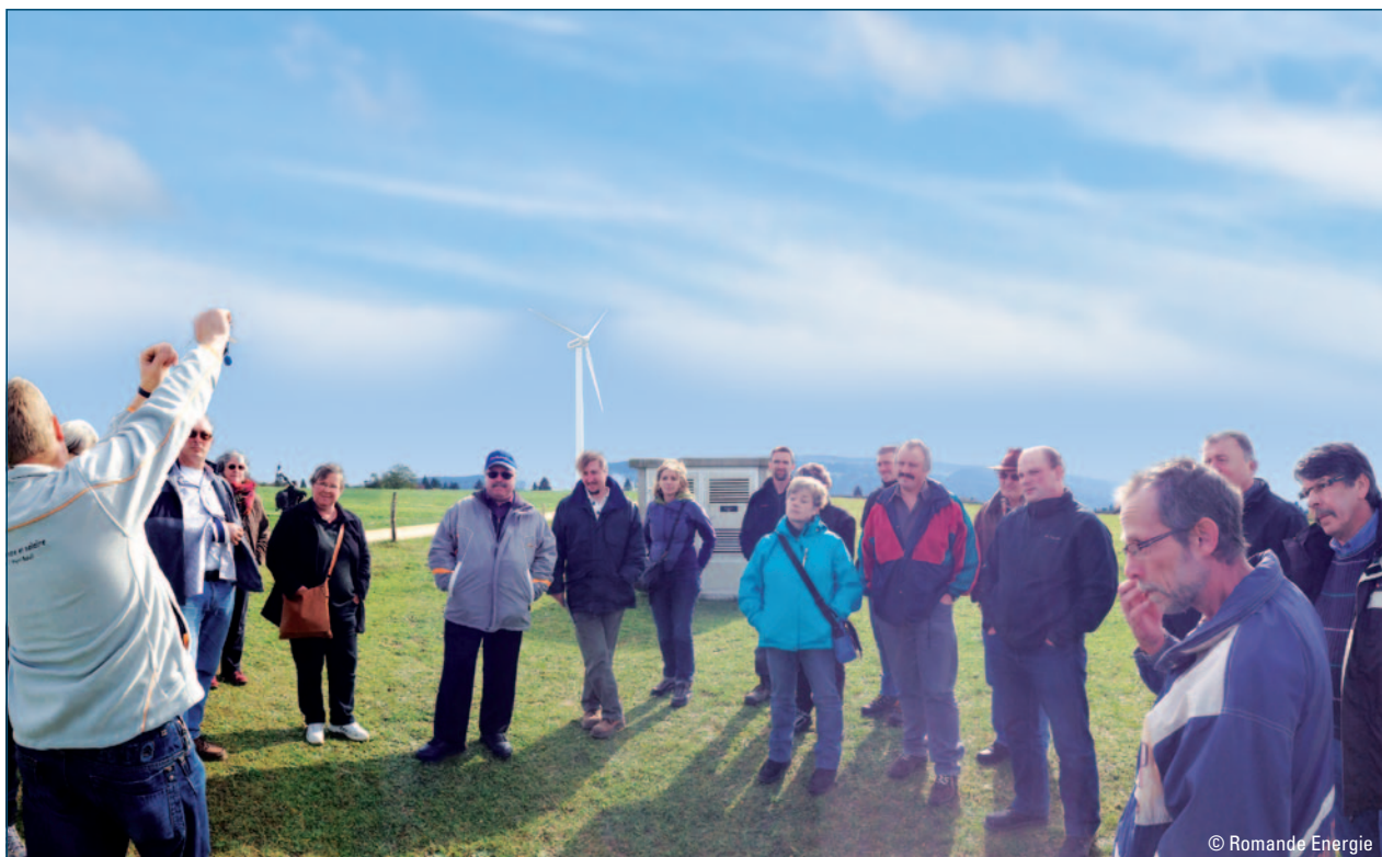
Le Conseil communal de Provence en visite sur le site éolien du Mont-Crosin dans le canton de Berne

Tant pour le canton de Vaud qu'en comparaison nationale, il s'agit d'un beau projet, de nature à contribuer significativement à l'apport des nouvelles énergies renouvelables et aux besoins d'approvisionnement électrique du pays. Romande Energie et ewz se réjouissent de pouvoir le poursuivre.