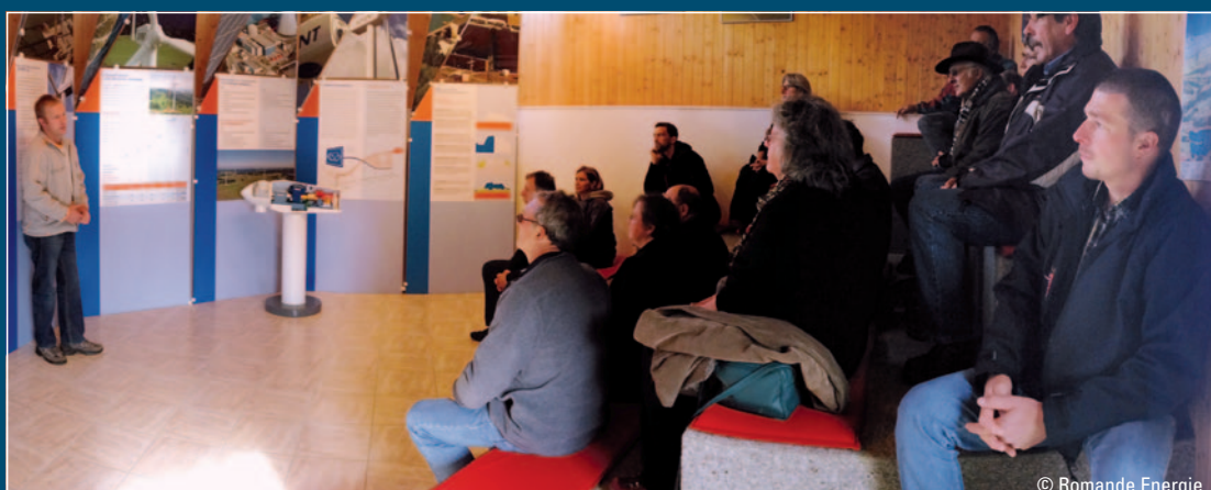
Centre d'information du Mont-Crosin

Début octobre, les représentants du Conseil communal de Provence qui le souhaitent ont eu l'opportunité de se rendre, accompagnés des responsables du projet, sur les sites des parcs éoliens du Mont-Crosin (BE) et du Peuchapatte (JU) ainsi que dans le village de Saint-Brais (JU), à proximité d'un parc éolien.